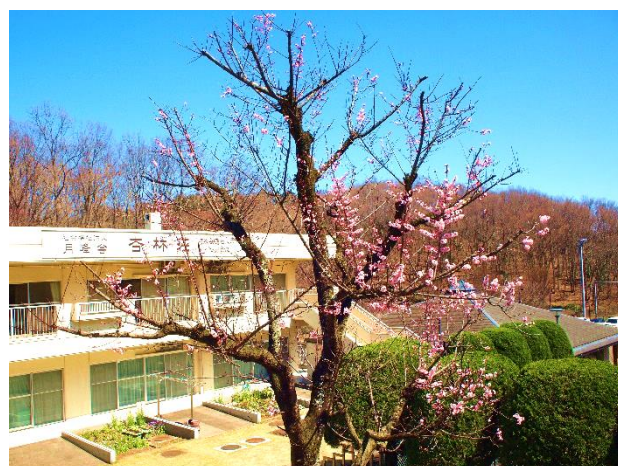
↑ 杏林荘のシンボル 杏の木です!!

杏林荘は、家での生活が難しくなったお年寄りが生活する施設です。施設の職員が健康管理や介護を行っています!