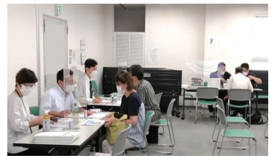
採用担当者との個別相談