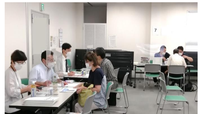
採用担当者との個別相談