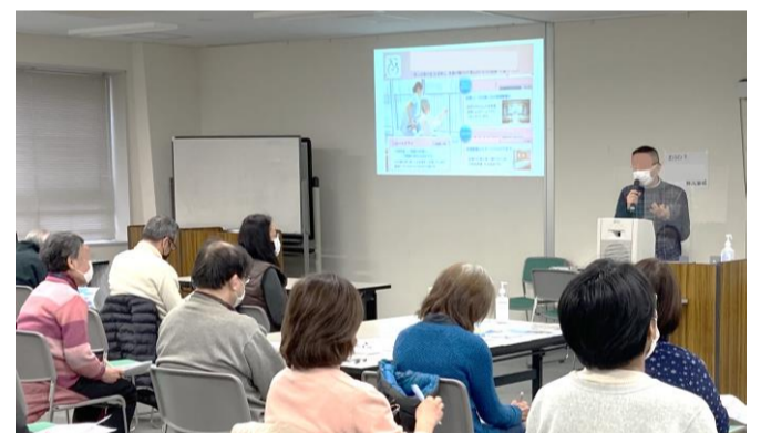
写真・動画による法人説明