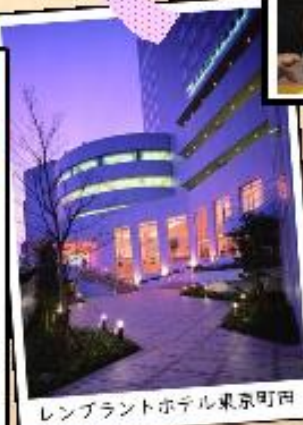
レンブラントホテル東京町田

2022年8月8日より レンブラントグループの 一員となりました。 福利厚生が使えます。