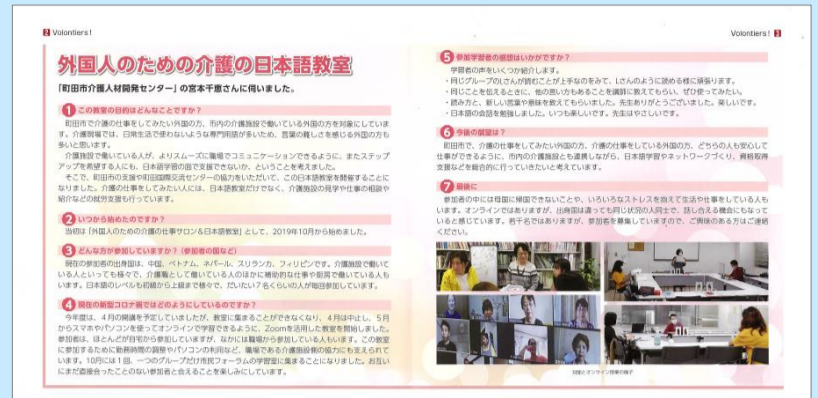
▲ 国際交流センター機関紙 ぼろんていえ による取材

まだ一度も実際に会ったことのない参加者もいるため、教室に集まって学習ができるようになる日を心待ちにしています。