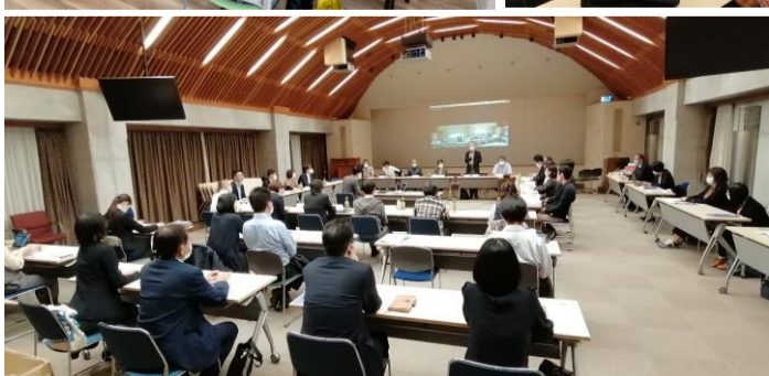
▲ 町田・安心して暮らせるまちづくりプロジェクト協議会