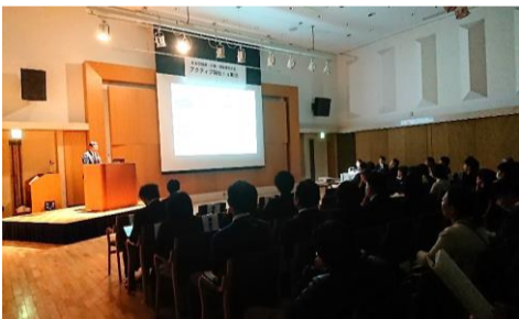
▼ アクティブ福祉in町田 従来型の会場での研究発表