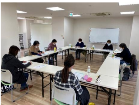
▼ 介護福祉士国家試験受験対策直前講座