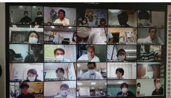
▼ 通所事業所連絡会オンライン会議