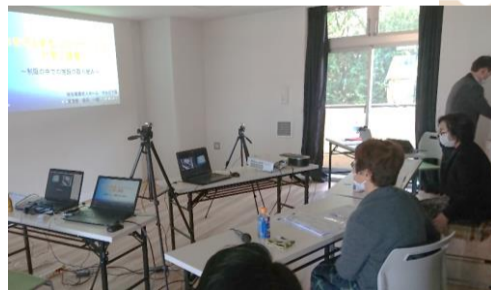
▼ 2020年度アクティブ福祉in町田 オンライン研究発表審査の様子