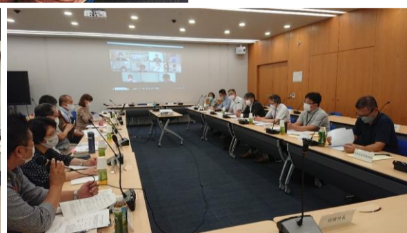
▼ 高齢者福祉施設部会