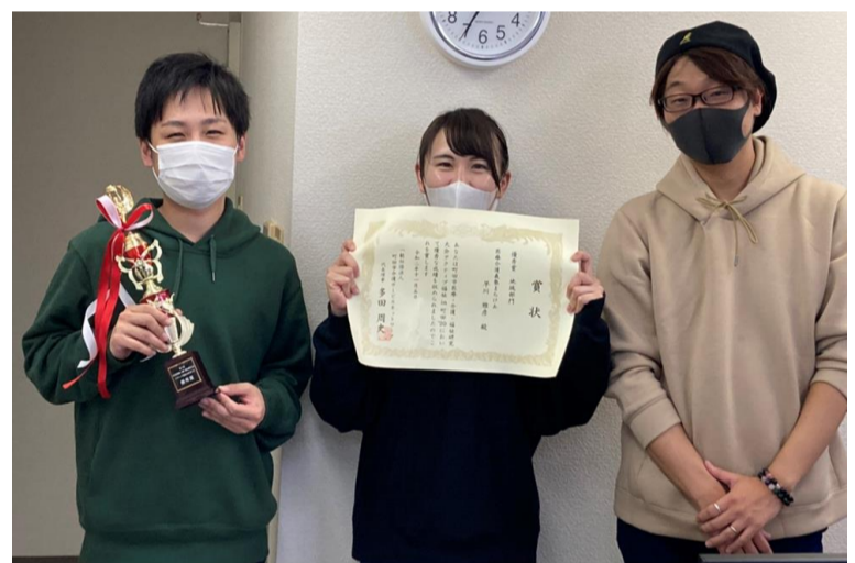
「アクティブ福祉in町田'20」で優秀賞をいただきました

参加者の方が当団体を「もう一つの居場所」だと、色々な人との繋がりを通して感じて頂く事を大事にしています。