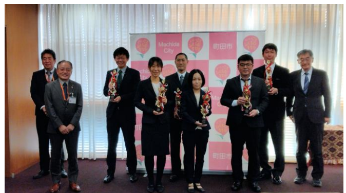
受賞された皆様と石阪市長

開催前に市庁舎1階 イベントスペースにて、アクティブ福祉と当センターの紹介を行いました。