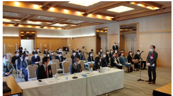
石阪市長より開会の挨拶

11月9日(水)に第16回 町田市医療・介護・福祉研究大会「アクティブ福祉 in 町田'22」を3年ぶりに町田市文化交流センターで開催しました。今年度は、会場での発表、オンラインでの発表と合わせて13題の発表が行われたほか、介護の仕事相談会、介護川柳などの掲示を行いました。皆様のご参加、ご協力、ありがとうございました。厳正なる審査の結果、13題の発表のなかから、町田市長賞、審査員賞、優秀賞「施設・在宅・地域・市民活動(新設)」、特別賞を決定し、授賞式を行いましたので、お知らせいたします。