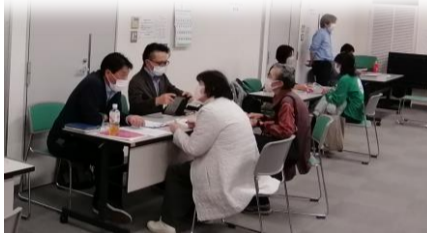
採用担当者との個別相談