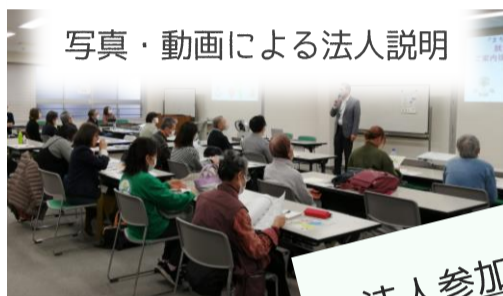
写真・動画による法人説明